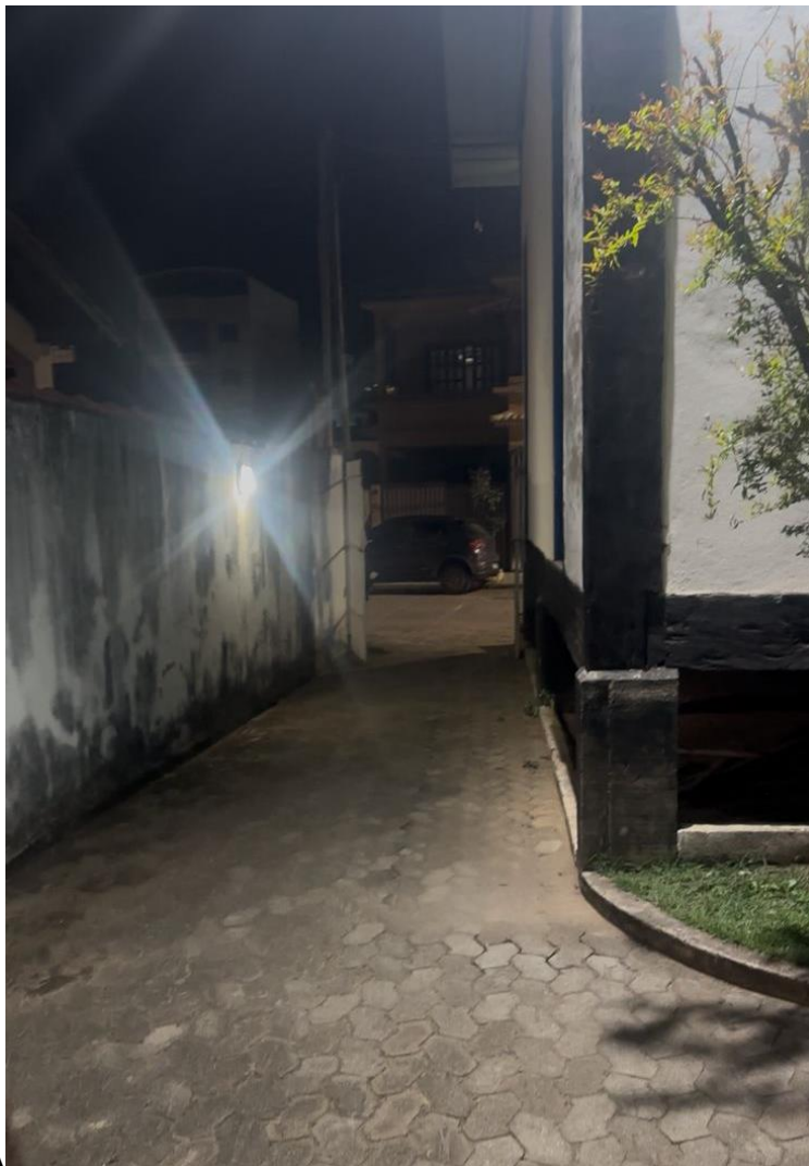
LUZ NOTURNA - HALL DE ENTRADA