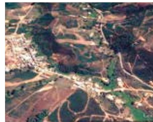
■ Santa Clara