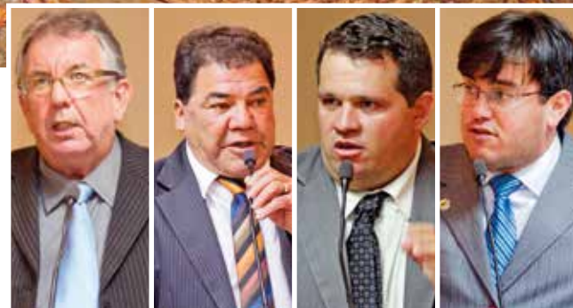
■ Vereadores intensificam proposições ao Poder Executivo para que medidas de educação e aplicação de investimentos para recuperação de nascentes sejam realizadas