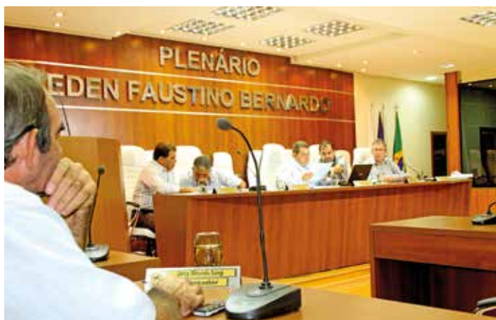
Em sessão extraordinária, Câmara aprova revisão de salários dos servidores do Executivo e Legislativo municipais

sa a valer imediatamente a partir da aprovação da Casa de Leis, retroagindo seus efeitos a 1º de janeiro de 2015, data-base da categoria dos servidores públicos.