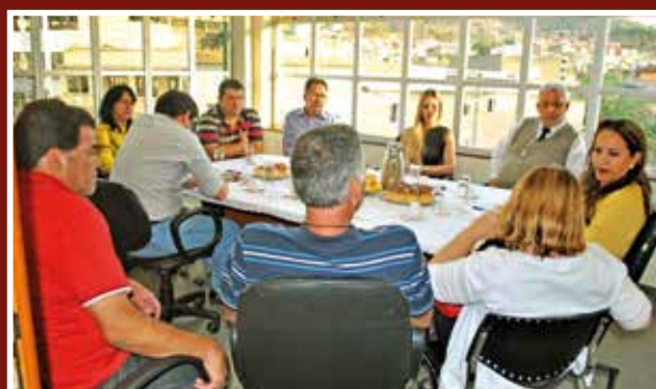
■ Vereadores, secretários e sociedade reunidos para discutir o funcionamento do Conselho Antidrogas

Os participantes também discutiram sobre as frentes de trabalho que poderão ser realizadas, no sentido da prevenção, tratamento e reinserção social, governança e pesquisa, e capacitação e informação.